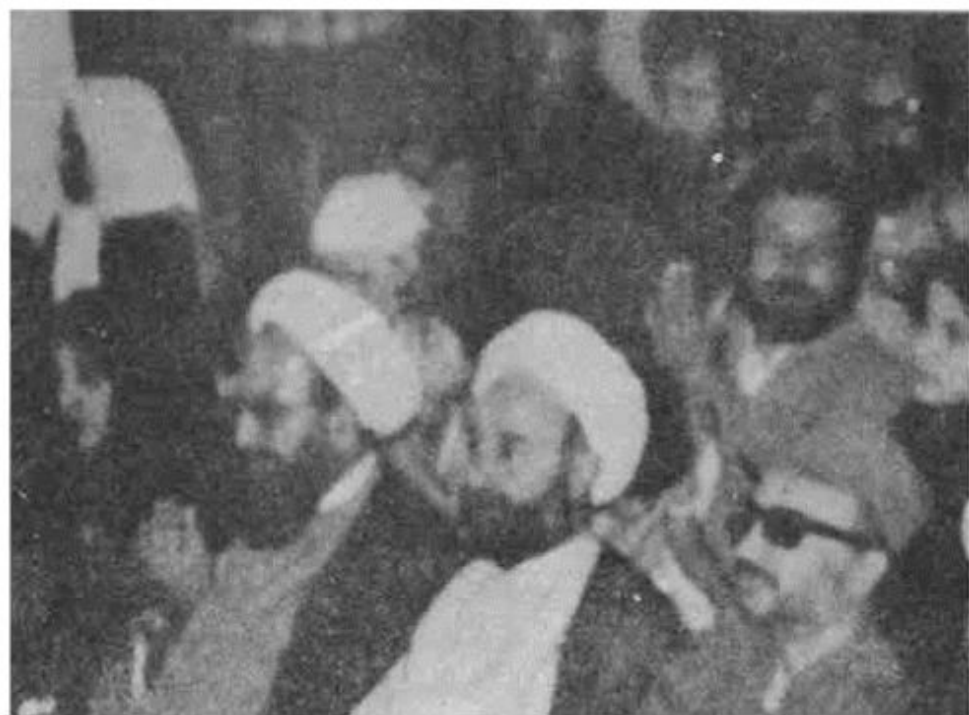
صحنه‌ای دیگر از مراسم بزرگداشت معلم شهید. همسر معلم انقلاب و عرفات در عکس دیده میشوند.