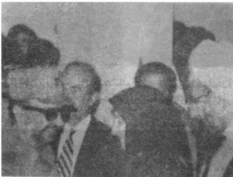
همسر معلم شهید هنگام ملاقات با یاسر عرفات در مراسم بزرگداشت معلم شهید .