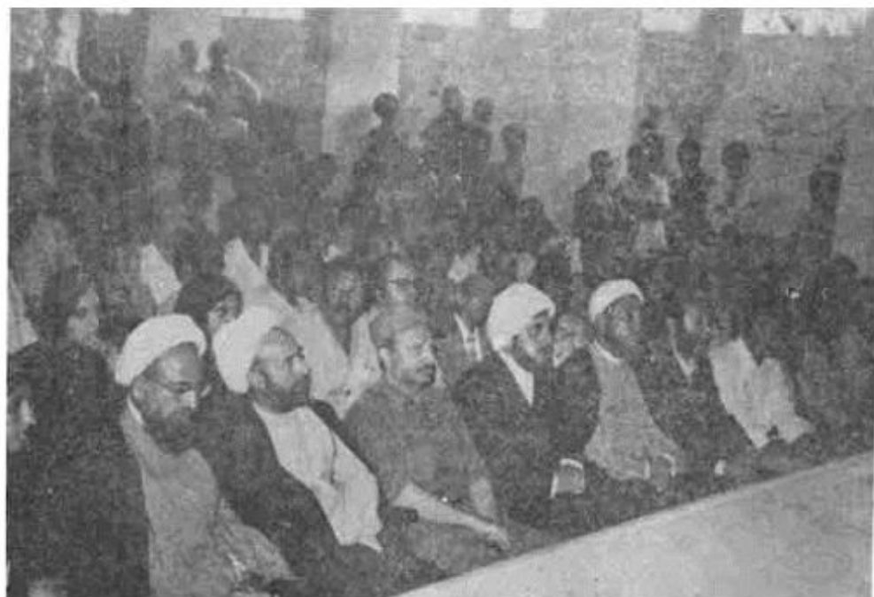
گوشه‌ای از مراسم بزرگداشت معلم شهید در بیروت، خانواده معلم شهید، عرفات و چند تن از علمای ایران و لبنان در عکس دیده می‌شوند.