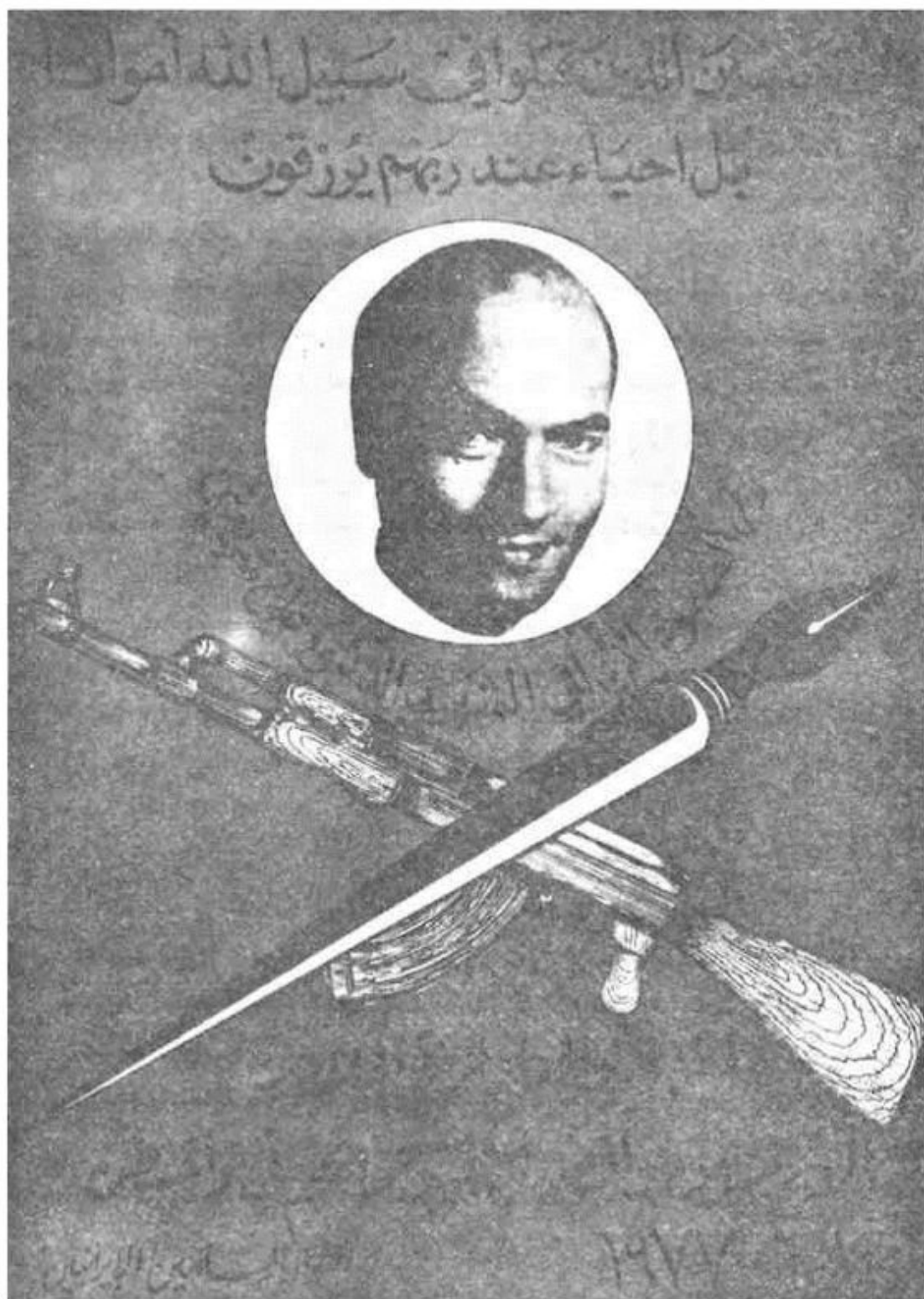
یک نمونه از پوستره‌های بزرگداشت معلم شهید دکتر شریعتی در بیروت .